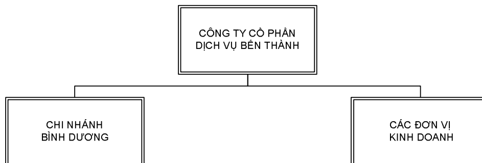
Hình 1: Sơ đồ tổ chức

Cơ cấu tổ chức của Công ty hiện nay bao gồm: Trụ sở chính, 07 trung tâm kinh doanh trực thuộc và 01 chi nhánh.